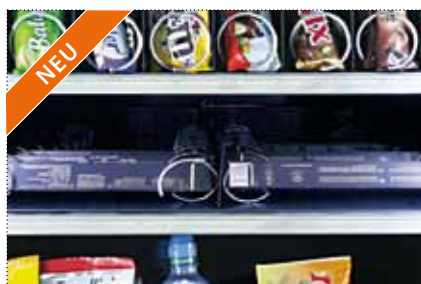
NEU DUO SYNCHRO SPIRALE - Innovatives System - Doppelmotorantrieb - Ideal für große Produkte