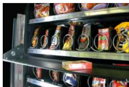
SCHNELLER PRODUKTLIFT Empfindliche oder zerbrechliche Produkte können auch aus den oberen Etagen ausgegeben werden