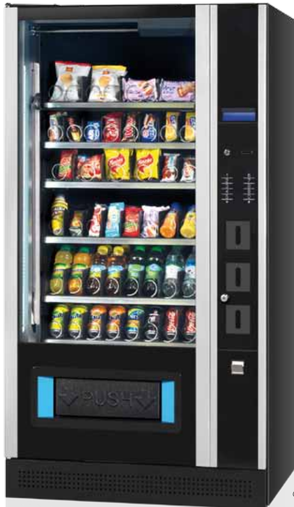
G-Snack Design 8 Master