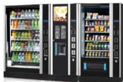
Komplette "Design Line"