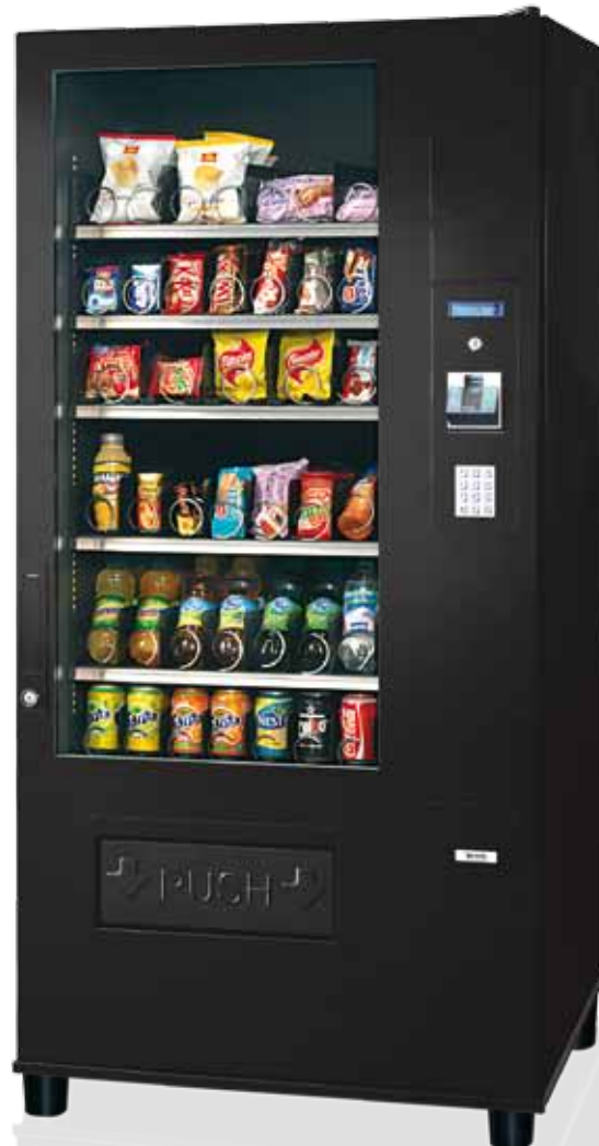
G-Snack Budget Master 8